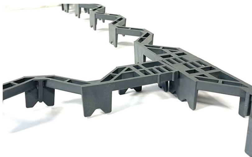
Figure 1 : Vue 3D